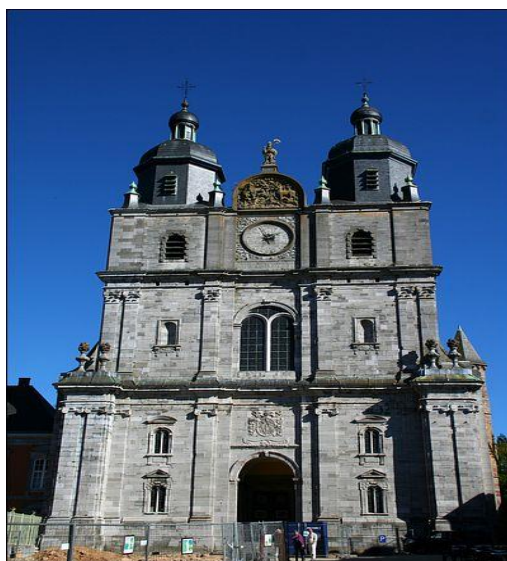
Basilique de Saint-Hubert.

C'est sur les points telluriques puissants de cette Terre Sacrée.... sur ce lieu choisi qui guérit, qu'un travail vibratoire se fait à l'intérieur de notre corps dans un travail individuel au sein du groupe aimant.